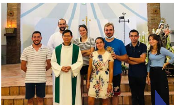
L'équipe de Mission Barcarès lors des veillées d'adoration.